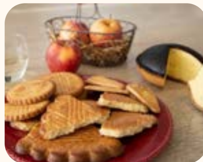
Stands de produits locaux

Ces espaces, riches en découvertes et en gourmandises , contribueront à l'animation du site et à la convivialité de l'événement.