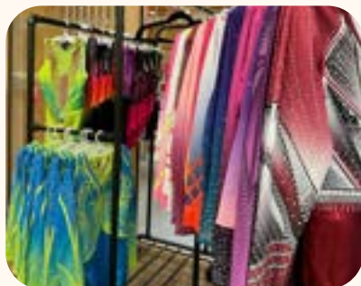
Boutiques de justaucorps