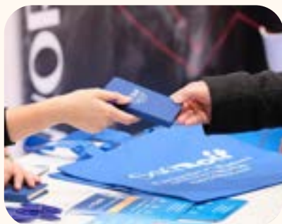
Goodies officiels de l'événement