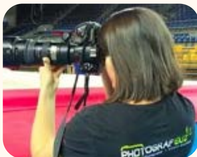
Stand photographe professionnel